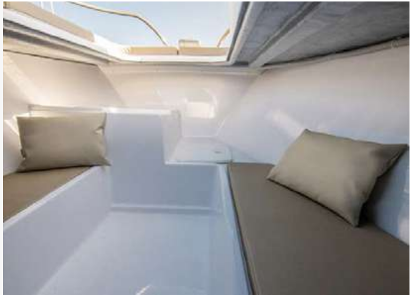
Libeccio -7.0 center console-