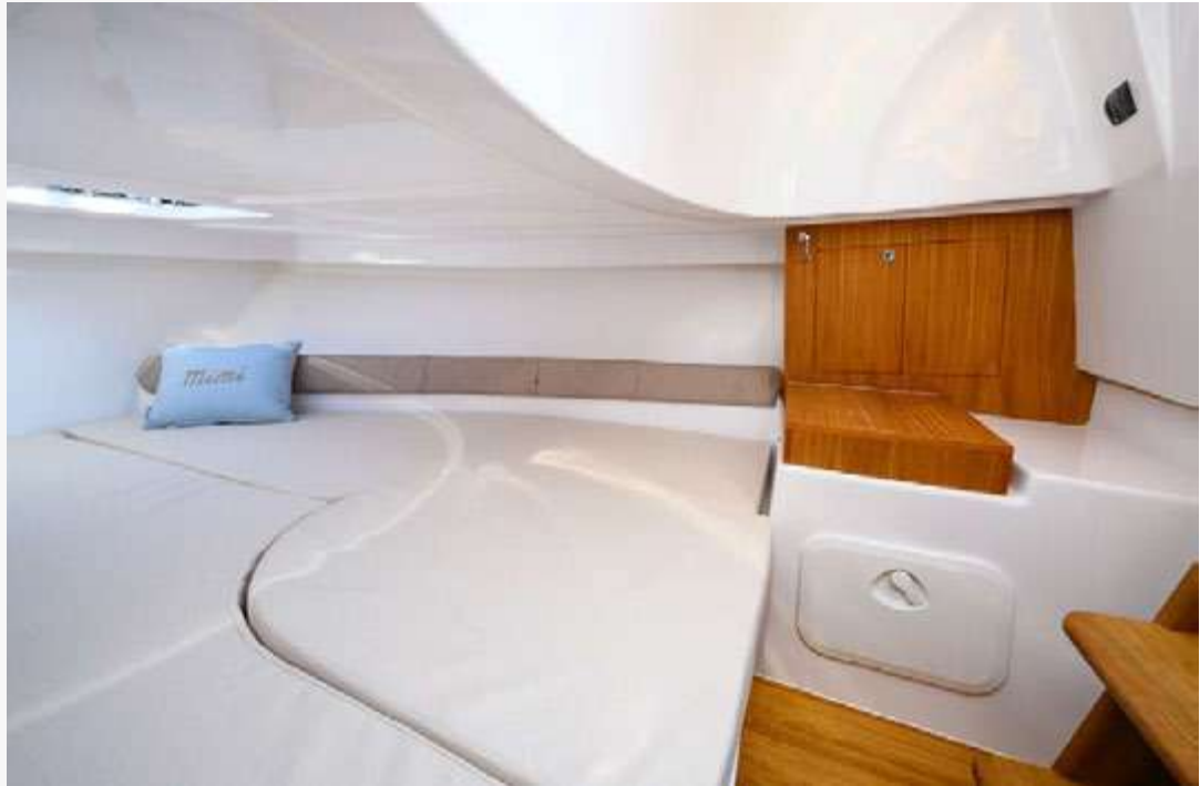
Libeccio — 7.5 open —