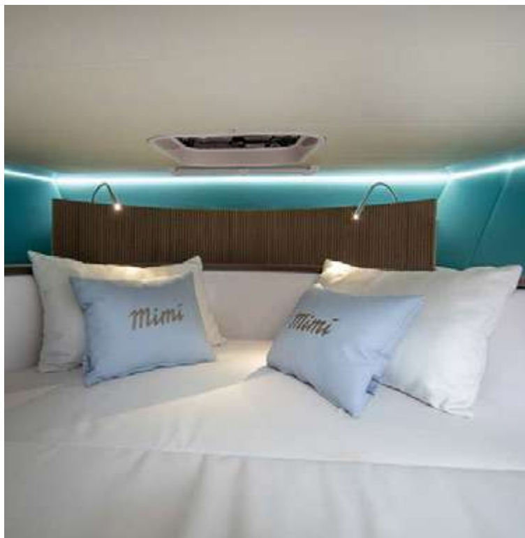
Libeccio — 8.5 wa —