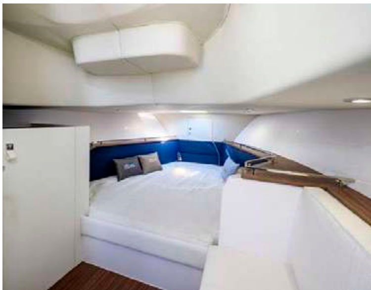
Libeccio — 9.5 wa —